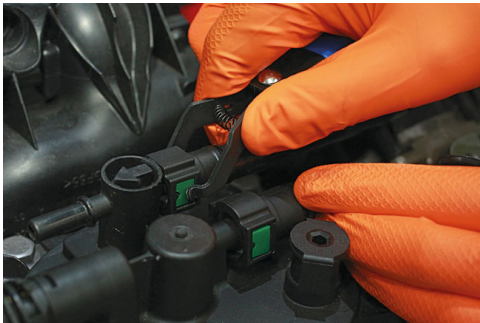
Scarab Quick Connector Disconnect Tool | 7826